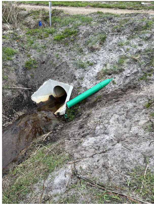
Durchlass Bogenspieler Kanal