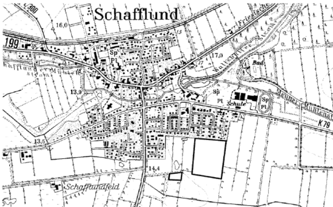
Karte: Lageplan der beiden Teilgeltungsbereiche des Bebauungsplanes Nr. 33

Während der Auslegungsfrist können alle an der Planung Interessierten die Planunterlagen und umweltbezogenen Stellungnahmen einsehen sowie Stellungnahmen nur zu den geänderten Festsetzungen, siehe rote Markierungen , schriftlich oder während der Dienststunden zur Niederschrift abgeben. Nicht fristgerecht abgegebene Stellungnahmen können bei der Beschlussfassung über den B-Plan unberücksichtigt bleiben, wenn die Gemeinde den Inhalt nicht kannte und nicht hätte kennen müssen und deren Inhalt für die Rechtmäßigkeit des B-Planes nicht von Bedeutung ist.