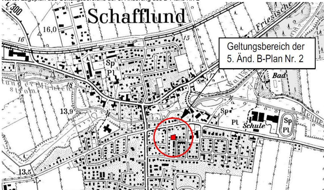
Karte: Lageplan des Geltungsbereichs der 5. Änderung des B-Plans Nr. 2

Während der Auslegungsfrist können alle an der Planung Interessierten die Planunterlagen und umweltbezogenen Stellungnahmen einsehen sowie Stellungnahmen hierzu schriftlich oder während der Dienststunden zur Niederschrift abgeben. Nicht fristgerecht abgegebene Stellungnahmen können bei den Beschlussfassungen unberücksichtigt bleiben, wenn die Gemeinde den Inhalt nicht kannte und nicht hätte kennen müssen und deren Inhalt für die Rechtmäßigkeit der o. g. Bauleitplanungen nicht von Bedeutung ist.